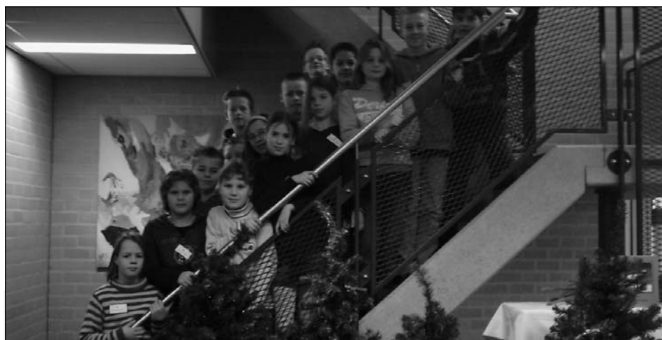
KlasseFoto groep 8 de redactie van KlasseVerhalen Maximaschool