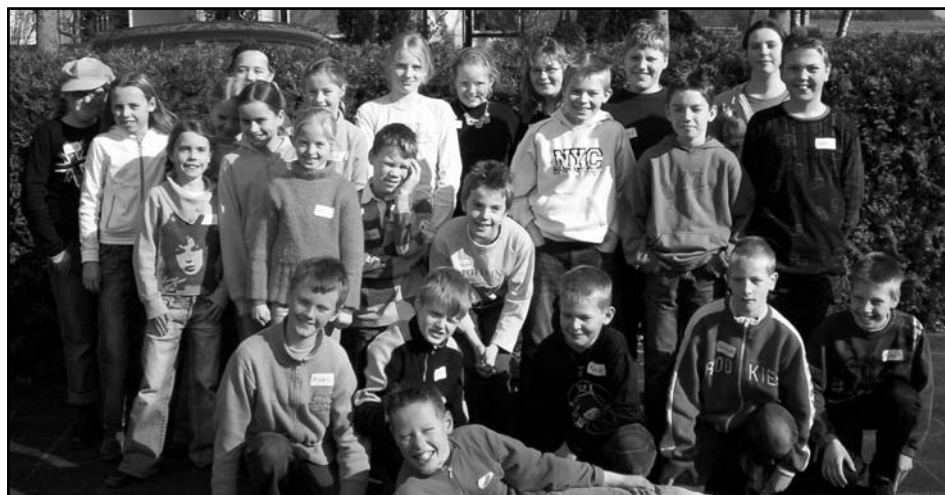
Kinderen in Balk zijn dagen druk geweest met de voorbereiding van KlasseVerhalen.