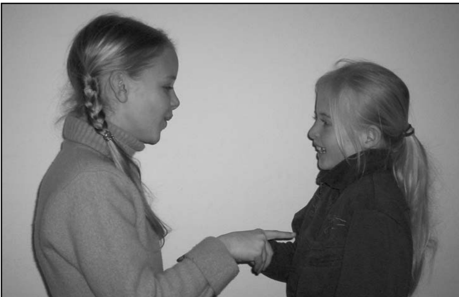
Kinderen van CBS de Bolster communiceren ook met handen.

Als we op vakantie gaan naar een land waarvan je de taal niet spreekt, kunnen wij toch meestal duidelijk maken "met handen en voeten" wat wij bedoelen.