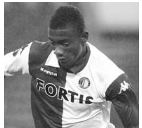
Kalou in actie