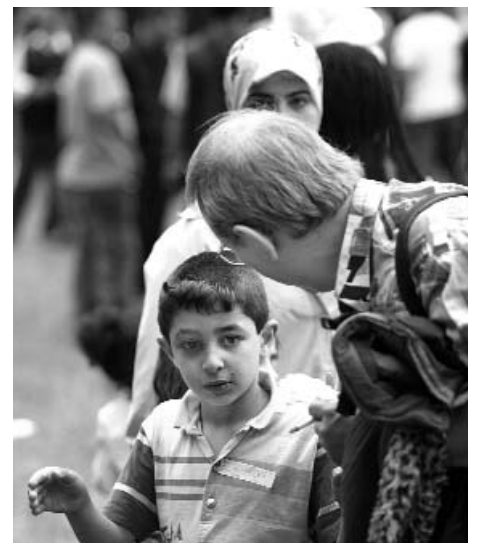
Een kind wordt toegesproken.