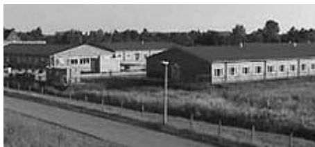
Kinderen in Stiens zijn dagen druk

In het azc zitten mensen vaak met twee of soms drie gezinnen in een huis. Ze zitten meestal heel krap.