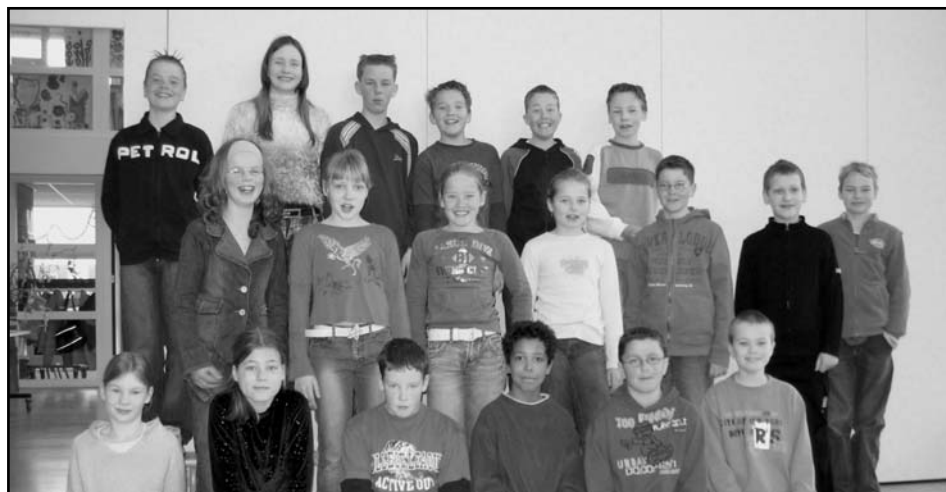
Kinderen in Ferwert zijn dagen druk geweest met de voorbereiding van KlasseVerhalen.