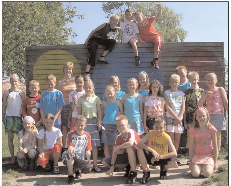
Weer een leuke editie door onze journalisten van de basisschool De Bron

En iedereen een mooi huis en genoeg geld heeft.