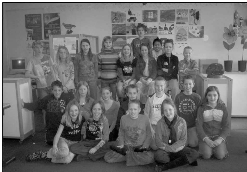
De complete redactie van de Dr. J. Botkeschool