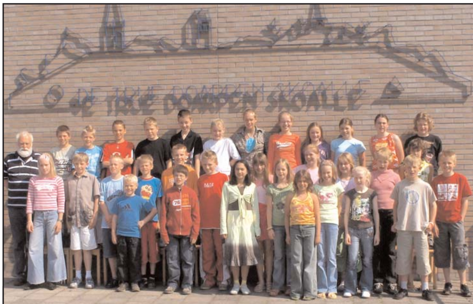
De redactie van groep 7 en 8 van De Trije Doarpenskoalle.