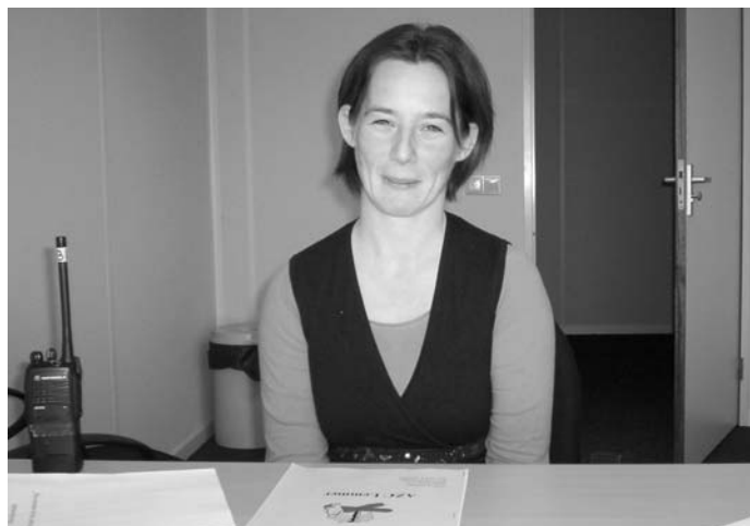
De receptioniste van het AZC in Lemmer

De jongste inwoner is hooguit twee weken en de oudste inwoner is zesentachtig.