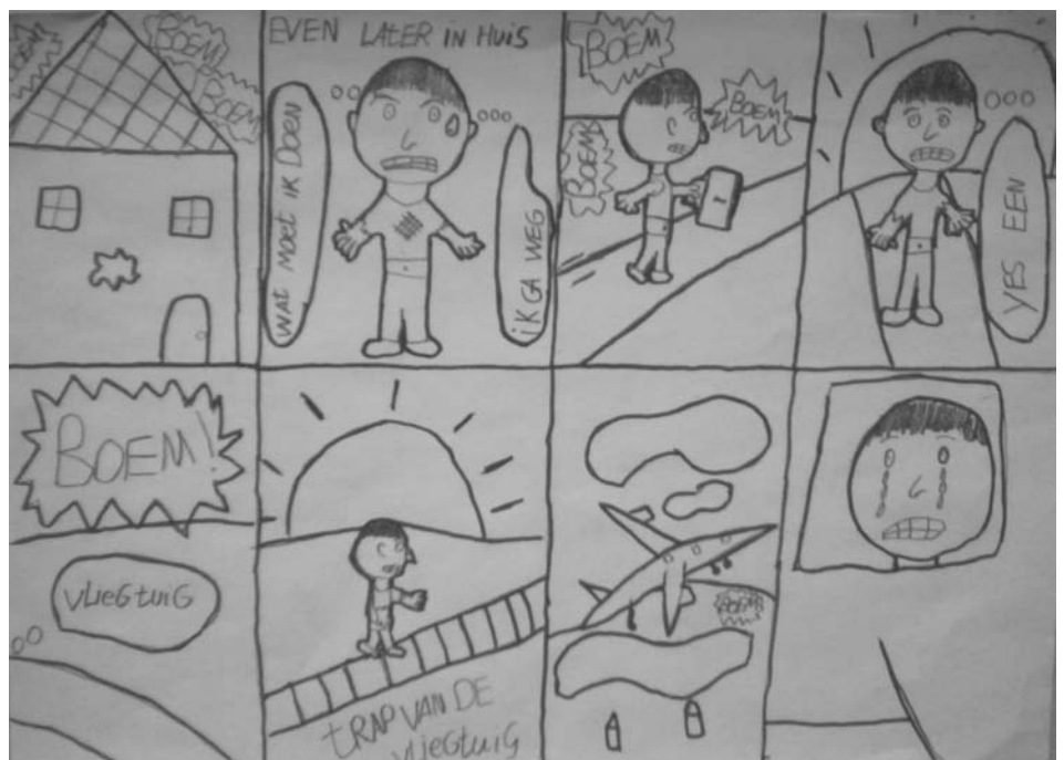
Deze strip is gemaakt door Kevin en Harmke