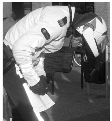
Een politie ondertekent de petitie