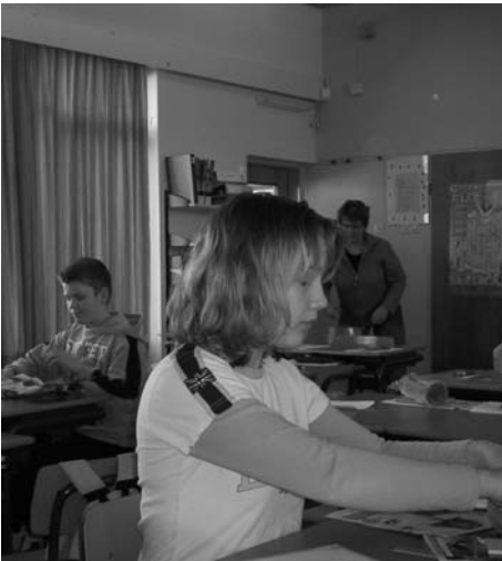
Aan het werk voor KlasseVerhalen

Op maandag 13 maart zijn de leerlin- gen van groep 7 en 8 van OBS de Meerpaal in Lemmer begonnen met het project KlasseVerhalen. Tijdens de introductie-ochtend hebben de leerlingen zelf allerlei onderwerpen bedacht om over te schrijven.