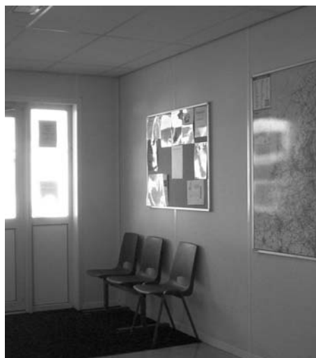
De entree van het AZC in Lemmer