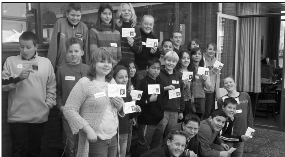
Kinderen in Lemmer zijn dagen druk geweest met de voorbereiding van KlasseVerhalen.

Ook het verslag van de demonstratie is terug te vinden in de krant.