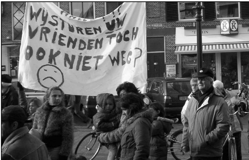
Demonstranten tonen een spandoek met de tekst: Wij sturen uw vrienden toch ook niet weg