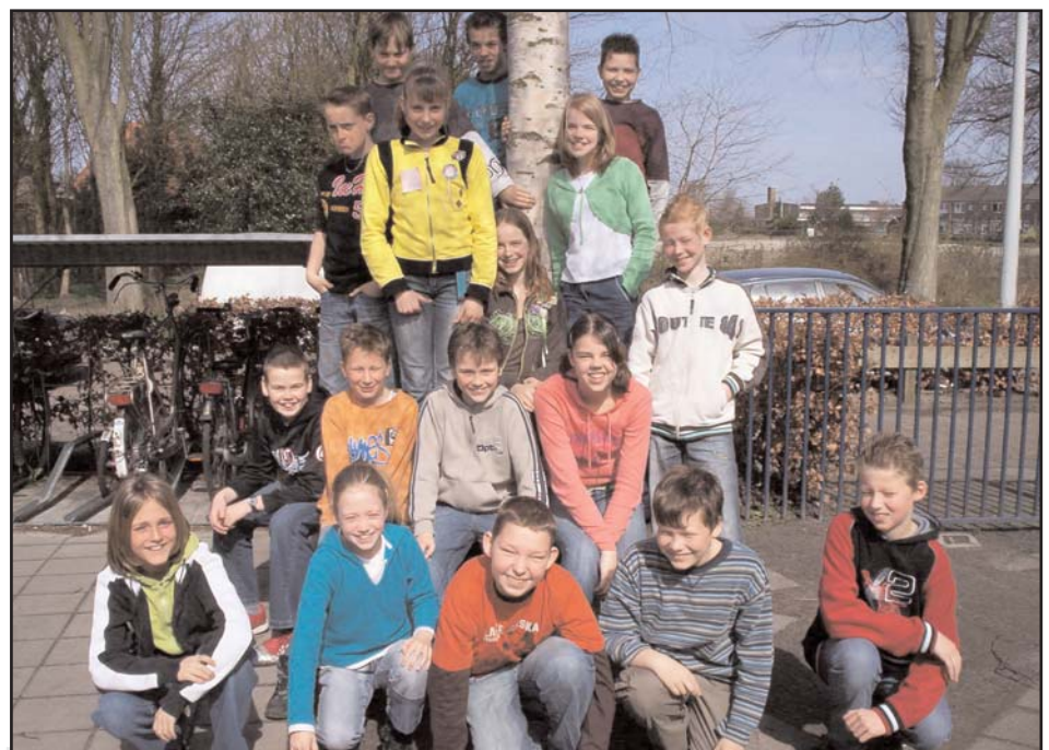
Een leuke groep redacteurs hebben zich ingezet voor deze editie van Klasseverhalen