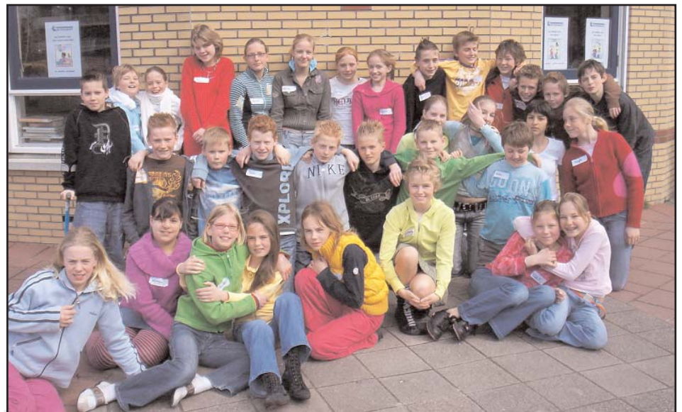
De complete redactie van OBS De Oudvaart

Voetbal Boksen Gewichtheffen Hockey Cricket