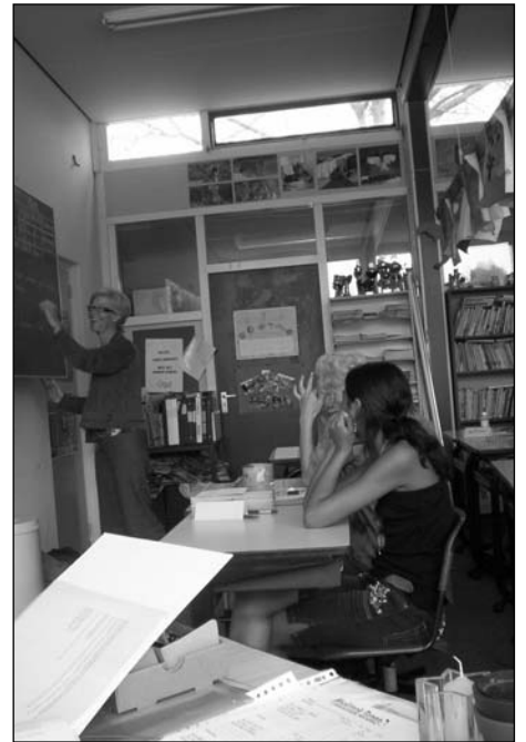
Groep 7 en 8 van de OBS De Opslach luisteren aandachtig naar de verhalen.