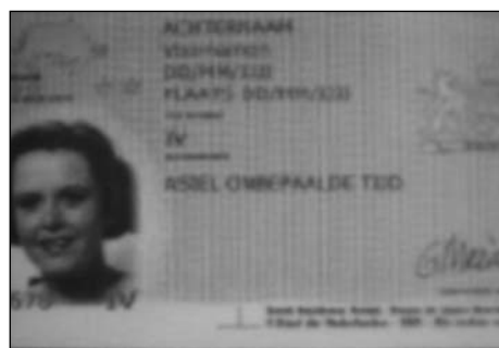
De meeste vluchtelingen in ons land wachten op een verblijfsvergunning, dit duurt soms jaren.