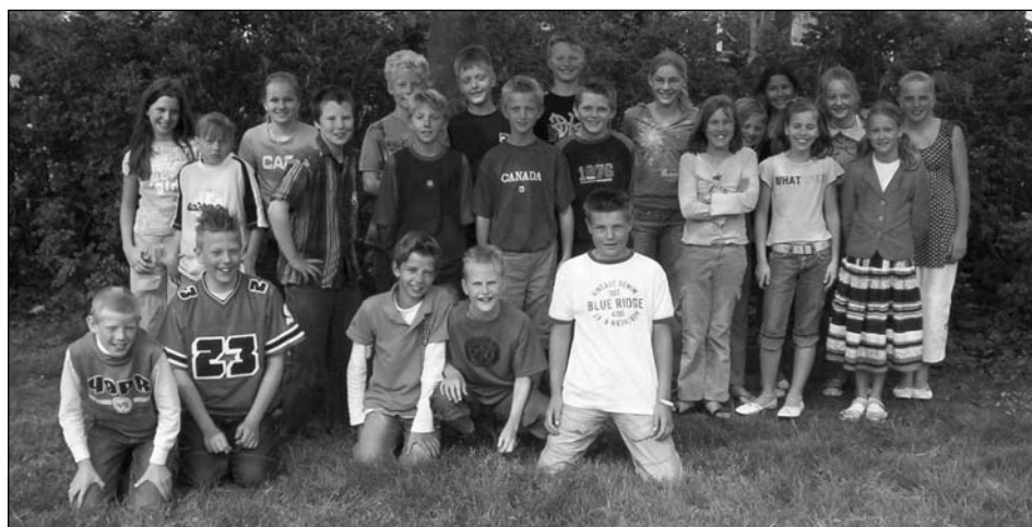
Het redactieteam van OBS De Opslach te Wommels.