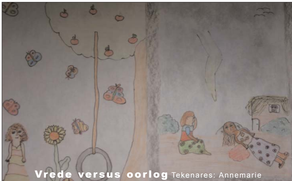
Vrede versus oorlog Tekenaars: Annemarie

er nog wel gevaar in hun land is kunnen ze nog in het centrum blijven. In die centra's zijn vaak ook scholen en bibliotheken en sporthallen. De kinderen kunnen op een AZC-school Nederlands lezen, praten en verstaan. Als ze dat kunnen dan hebben ze sneller een baan in Nederland (als ze hier mogen blijven). Tekst: Tim en Jurian