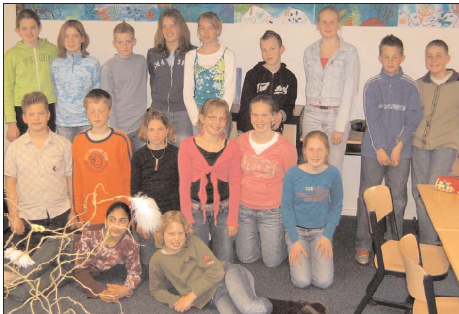
De Kinderen van CBS De Twine hebben erg hun best gedaan voor KlasseVerhalen.