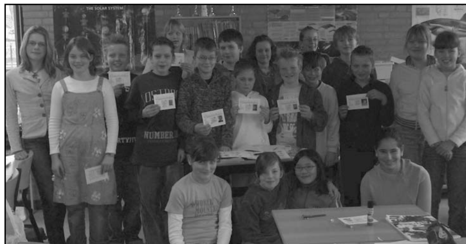
Kinderen in Bolsward zijn dagen druk geweest met de voorbereiding van KlasseVerhalen.