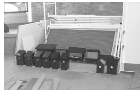
De vogelhuisjes in AVO