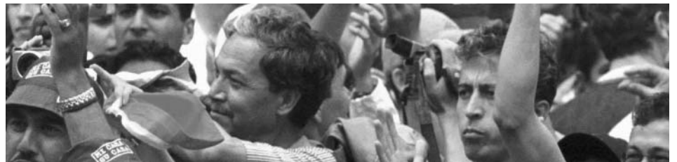
Mensenmassa op weg naar een beter bestaan

De omstandigheden waren erbarmelijk. Die beelden zal ik noot vergeten, er was geen schoon water, sanitaire voorzieningen ontbraken, tenten waren er niet. De toevloed van vluchtelingen was zo groot die middelen bij lange niet toerijkend waren".