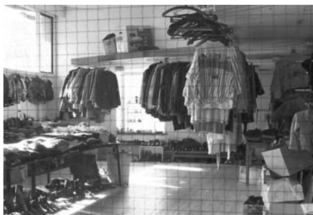
De kleding in AVO

We kregen ook een rondleiding. We kwamen eerst in een kamer waar vier vrouwelijke bewoners een