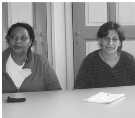
Twee vluchtelingen vertellen hun verhaal