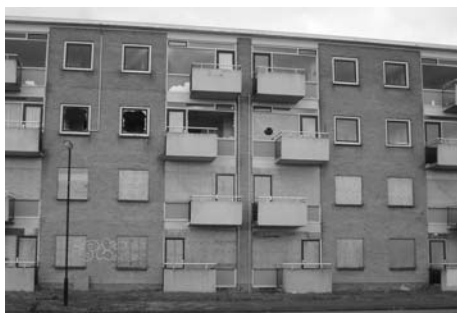
De flats staan er verlaten bij