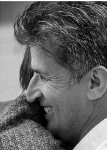
Voor sommige mensen valt er gelukkig nog wel wat te lachen.