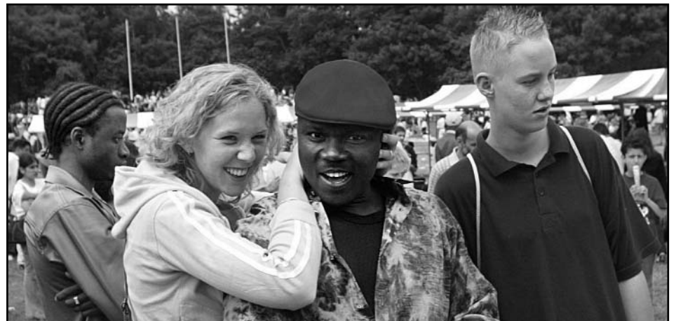
Verschillende geloven ontmoeten elkaar op een feest

Als u niet over een snelkookpan beschikt, dan zal het koken wat extra tijd nodig hebben!