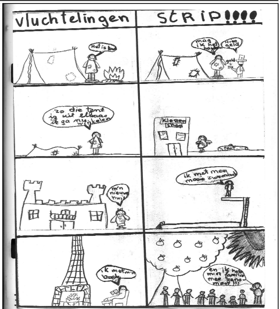
Esther en Elzemiek maakten deze striptekening over de vluchtelingen